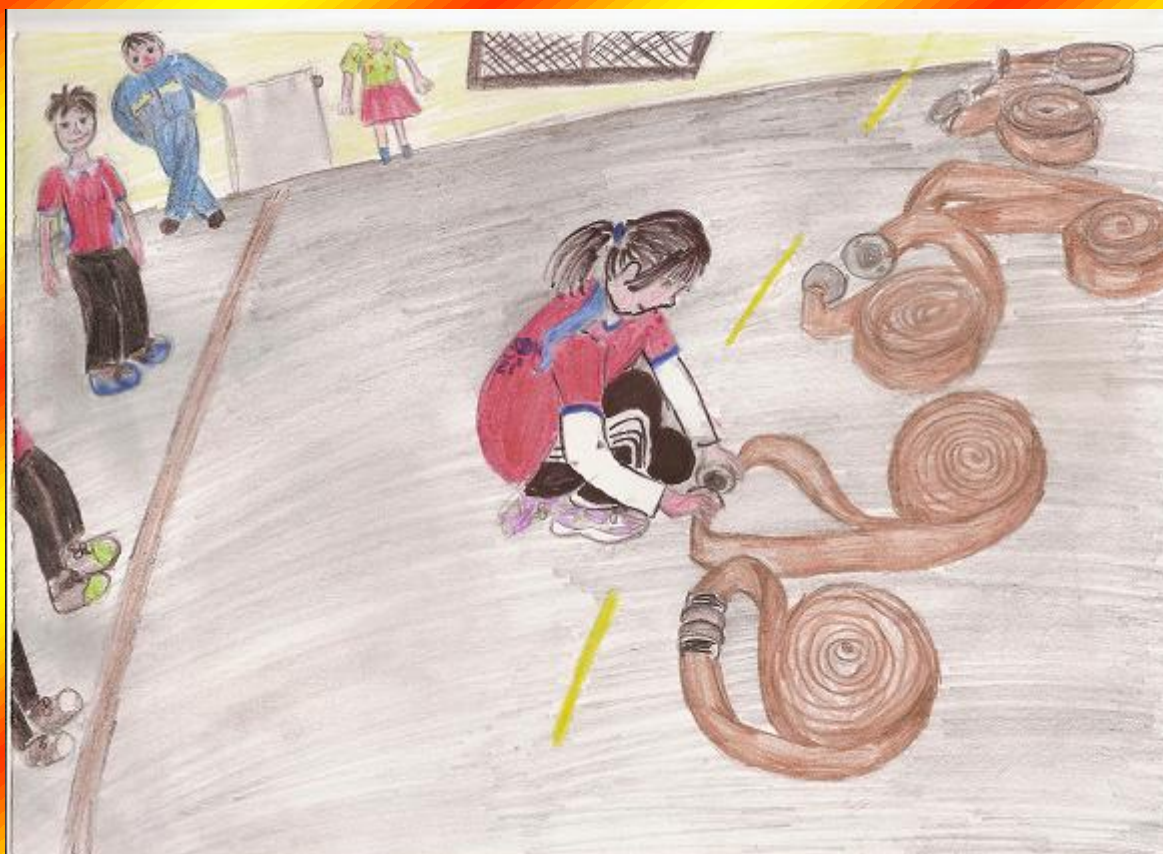
Obrázek Kateřiny Kaniokové (starší žáci)