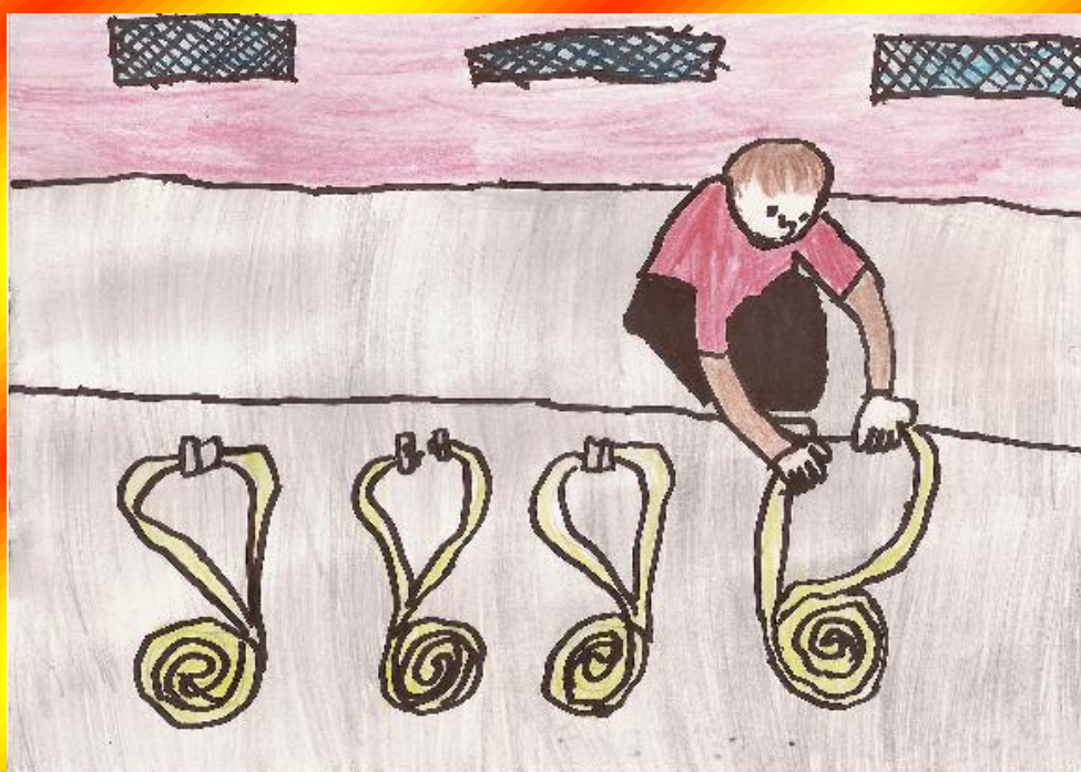
Obrázek Tomáše Kanioka (mladší žáci)